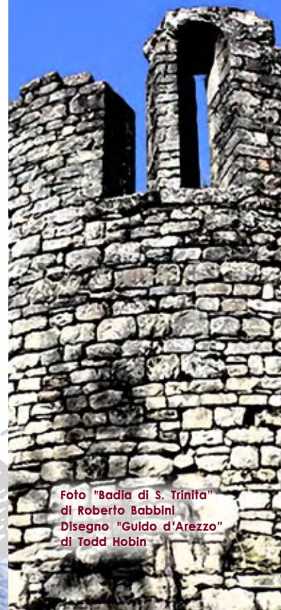
Foto "Badia di S. Trinita" di Roberto Babbini Disegno "Guido d'Arezzo" di Todd Hobin

DI TALLA E DEL CASENTINO INTORNO AL MILLE ANCORA SU